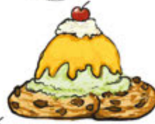
Warm Cookie Sundae 6.45