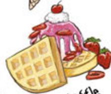
Warm Waffle Sundae 6.45