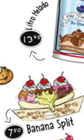
Banana Split 7.50