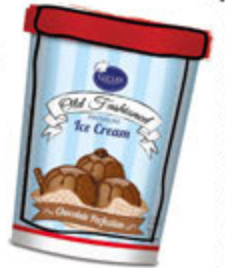
Litro Helado 13.45