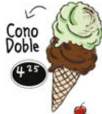
Cono Doble 4.25