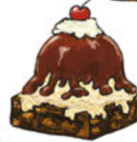
Warm Brownie Sundae 7.45