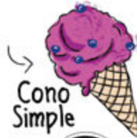
Cono Simple 3.99