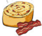
Tocino y Queso