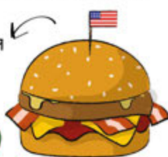
Bacon, BBQ & Cheese Burger

Queso, Salsa de Queso Tomate, Lechuga, Cebolla.