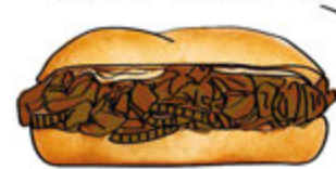
Cheese Pulled Pork

Champinones Salteados, Zucchini, Cebollas, Queso, Pimientos